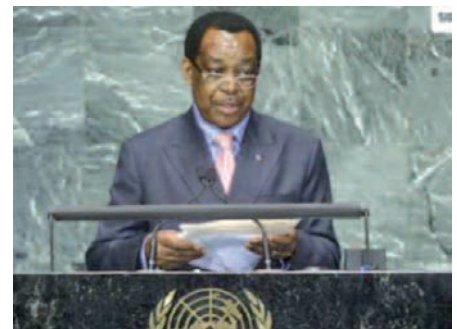
Pastor Micha Ondo Bile, ministre équato-guinéen des Affaires Etrangères.

S.E Pastor Micha Ondo Bile , Ministre des Affaires Etrangères, de la Coopération internationale et de la Francophonie de la République de Guinée Equatoriale, devant la 65 e session ordinaire de l'assemblée générale des Nations Unies à New York, lors de sa séance du 27 septembre 2010, a fait remarquer à l'assemblée avec toute la retenue diplomatique nécessaire, que cette tribune était l'occasion et le lieu appropriés, pour faire part une fois de plus de sa profonde inquiétude et de sa préoccupation occasionnée par l'attitude qu'il a qualifié d' irrespon-